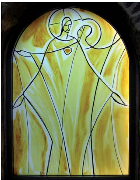
Christus und seine Braut im „Tausch der Herzen“. Kapellenfenster des brasilianischen Künstlers Claudio Pastro im Kloster Helfta.

(Aus: Gesandter der Göttlichen Liebe, Buch 3).