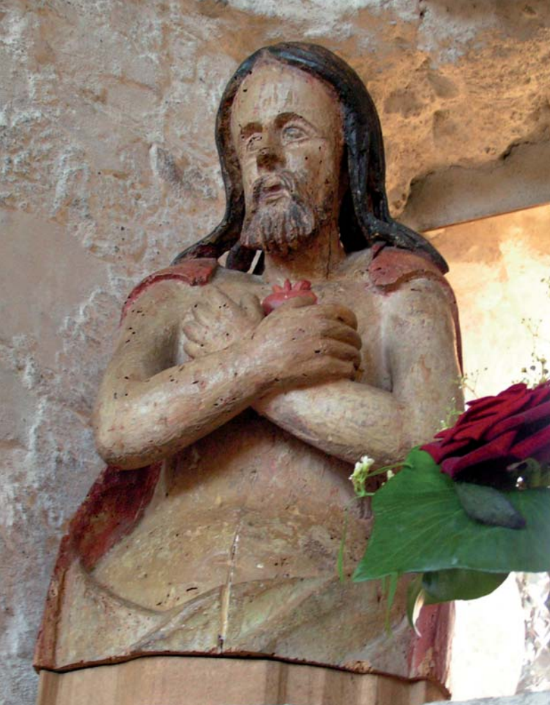
Herz-Jesu-Statue in der Klosterkirche Helfta.