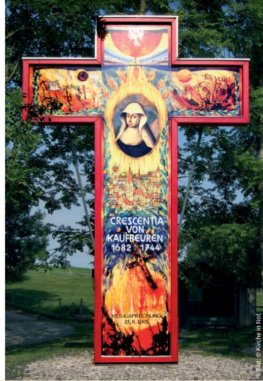
Kreuz mit einem Porträt der heiligen Crescentia auf der Fazenda da Esperanca in Irsee.

Am Samstag, 20. Mai 2023, von 09:45 Uhr bis ca. 20:30 Uhr