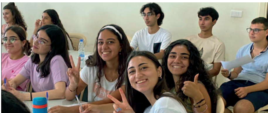
Glaubensfreude statt Zukunftsangst.

Mit 27 EURO können Sie einem Teilzeitkatecheten eine Woche lang sein Gehalt sichern, mit 40 EURO sichern Sie eine Woche das Gehalt eines Vollzeitkatecheten.