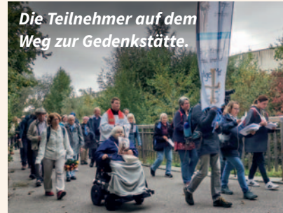
Die Teilnehmer auf dem Weg zur Gedenkstätte.