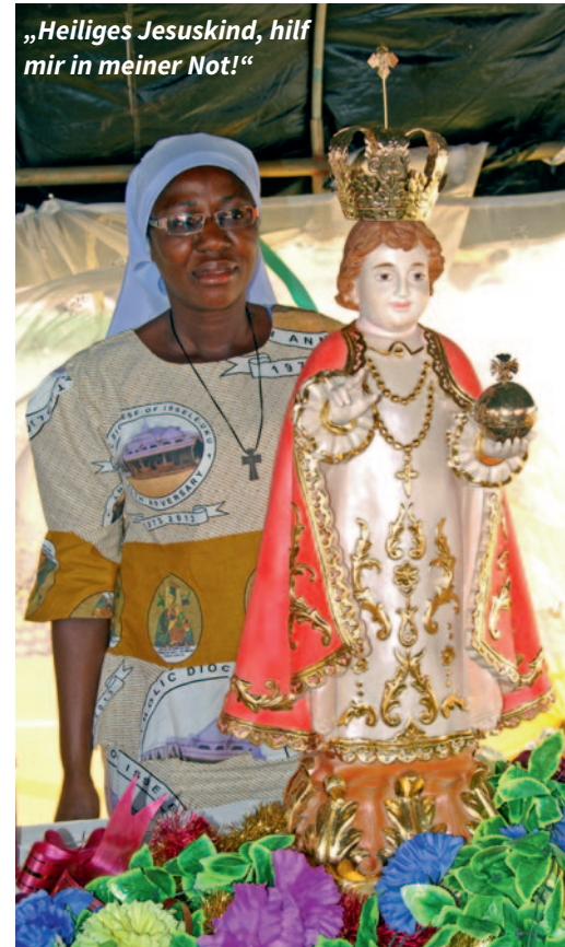
„Heiliges Jesuskind, hilf mir in meiner Not!“

Trotz der gefährlichen Lage reisen Pilger aus dem ganzen Land an. Ein junger Ordensbruder sagt: „Der rechte Arm des Jesuskindes, der zum Segen erhoben ist, gibt uns Frieden und innere Ruhe. Er vertreibt Angst und Furcht.“ Manche sind mehrere Tage unterwegs. Viele berichten von Gnaden, die das Jesuskind ihnen geschenkt hat, wie Pater Waltermary bezeugt: „Die Tochter einer Dame, die am Fest teilnahm, war entführt worden. Alle Pilger beteten um ihre Freilassung, und ich legte unter die Statue des Jesuskin-