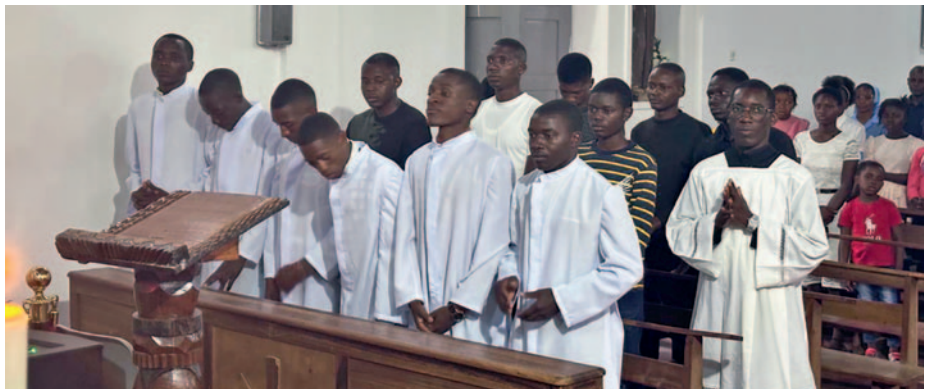
Sie möchten Priester werden.

Die 67 jungen Männer, die sich in der Diözese Lwena in Angola auf das Priestertum vorbereiten, sind alle ganz unterschiedlich. Gemeinsam haben sie, dass sie dem Ruf Gottes gefolgt sind.