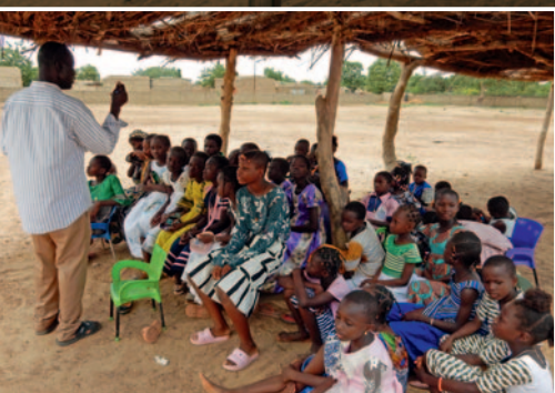
Katecheten verkünden die Frohe Botschaft in den kleinsten Dörfern.

Die Pfarrei von Rollo wurde 2023 von Terroristen überfallen. Die geflohenen Einwohner kehren erst nach und nach zurück. Nicht nur die drohende Gewalt,