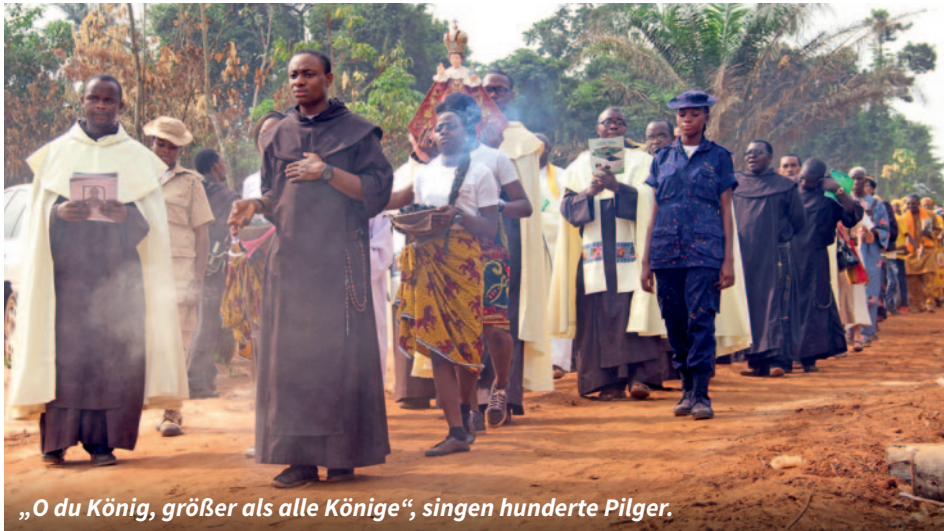
„O du König, größer als alle Könige“, singen hunderte Pilger.