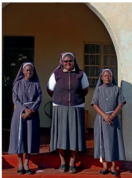
Sie haben noch keinen Strom. Helfen Sie ihnen?

Wir haben den afrikanischen Söhnen des heiligen Franziskus 29.500 Euro für einen Geländewagen versprochen, der den schlechten Straßenverhältnissen gewachsen ist. Helfen Sie mit?