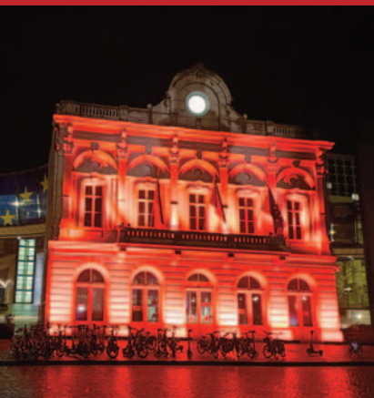
Gebäudeteil des Europäischen Parlaments in Brüssel.