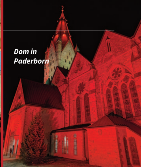
Dom in Paderborn