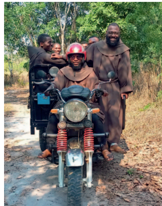
Ihr Schutzengel hat viel zu tun!

Die Wege in die Dörfer sind allerdings weit, und durch die Fahrten mit dem Moped geht viel Zeit und Energie verloren. Außerdem ist es gefährlich, zu mehreren mit einem Motorrad unterwegs zu sein, aber ein Taxi ist