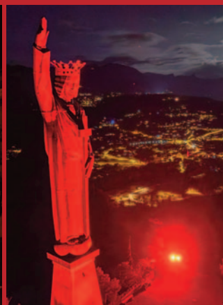
Christus-König-Statue in Lens.

Einen Rückblick auf die Aktion in Deutschland finden Sie auf der nächsten Seite.