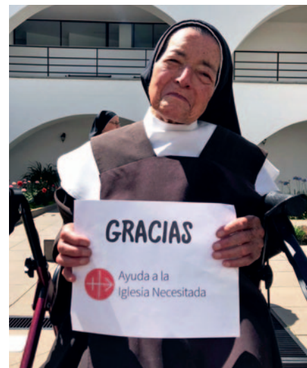
Kolumbien: „Danke, KIRCHE IN NOT!“

Kontemplative Ordensleute bringen stellvertretend die Nöte der ganzen Menschheit vor Gott. Bei Tag und bei Nacht erheben sie ihre Herzen und ihre Hände zum Herrn und bitten ihn um Hilfe und Barmherzigkeit für die ganze Welt. Sie sind „geistliche Kraftwerke“ oder das „Herz“ der Kirche, die die Energie für alle anderen Berufungen und Aufgaben spenden. Oft wird ihr stilles Dasein aber nicht verstanden. Viele sagen, sie sollten lieber etwas „Nützliches“ tun.