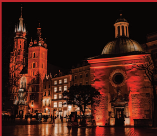
Kirchen in der Altstadt von Krakau.