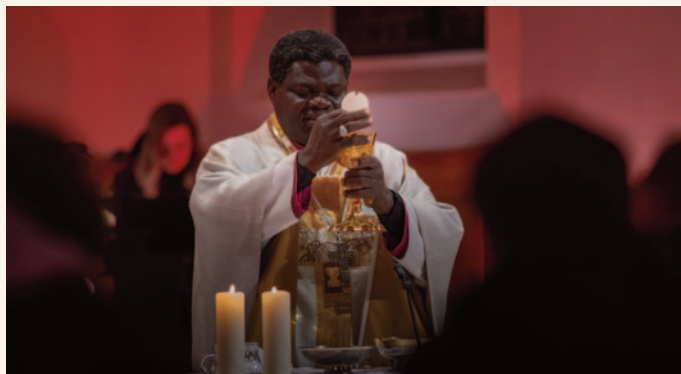
Heilige Messe mit Bischof Anagbe in Balderschwang.

In seiner Heimat leiden Christen unter islamistischem Terror, kriminellen Banden und ethnisch-religiösen Konflikten. In den nördlichen und zentralen Regionen Nigerias fänden nahezu täglich Anschläge und Übergriffe statt: „Kirchen werden niedergebrannt. Dörfer werden überfallen. Familien werden auseinandergerissen. Und doch hält die Kirche Stand.“