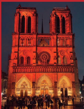
Kathedrale Notre-Dame in Paris.