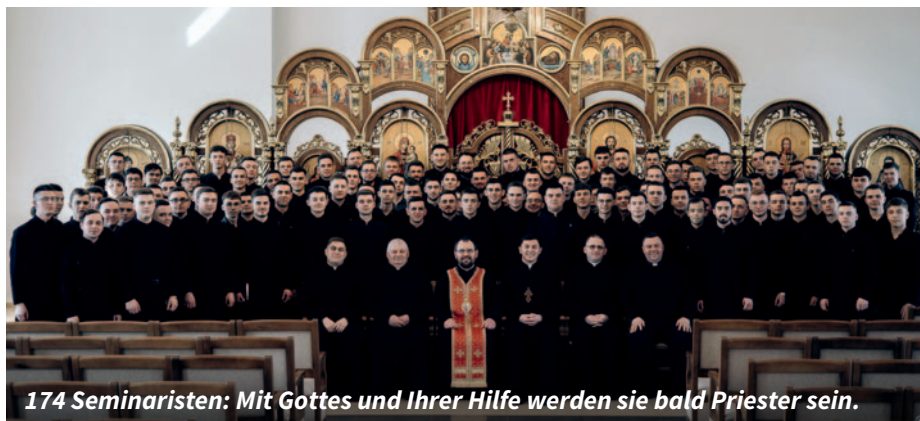
174 Seminaristen: Mit Gottes und Ihrer Hilfe werden sie bald Priester sein.

„Selig die Trauernden, denn sie werden getröstet werden“, singen die jungen Seminaristen. Wie Weihrauch steigt ihr Gesang auf – in der östlichen Liturgie ist er ein wesentliches Element der Liturgie. Viele von ihnen trauern selbst, denn der Krieg hat ihnen den Vater, einen Bruder, Freunde oder andere liebe Menschen genommen.