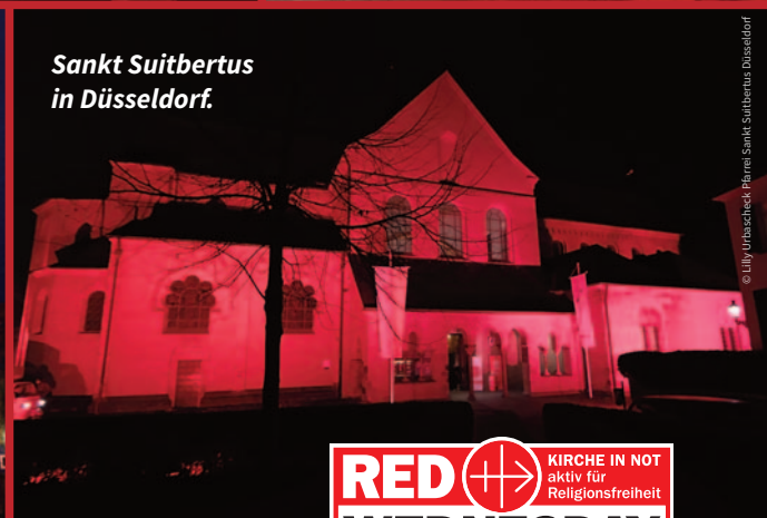
Sankt Suitbertus in Düsseldorf.

Machen Sie auch in diesem Jahr mit! Der Termin: Mittwoch, 18. November 2026.