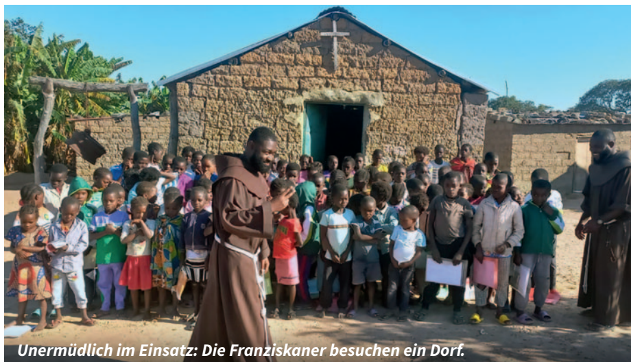
Unermüdlich im Einsatz: Die Franziskaner besuchen ein Dorf.

„Du bist heilig, Herr, einziger Gott, du tust Wunderbares“, schrieb der heilige Franz von Assisi, dessen 800. Todestag wir in diesem Jahr feiern. Oft wirkt Gott dieses Wunderbare durch Menschen, die sich von ihm in seinen Dienst rufen lassen.