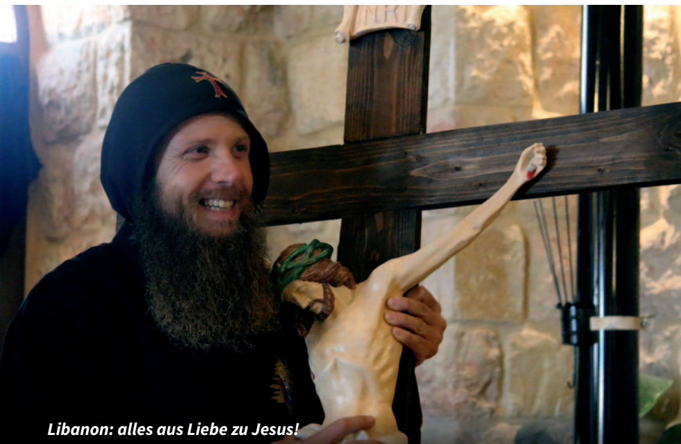
Libanon: alles aus Liebe zu Jesus!

Das Gebet ist eine reale Kraft. So überlebten vier Jesuitenpatres in Hiroshima die Explosion der Atombombe, ohne den geringsten Schaden zu nehmen, weil sie den Rosenkranz beteten. Aus dem Alten Testament kennen wir die Geschichte der Jünglinge im Feuerofen, die Gott lobten und priesen, während die Flammen ihnen nichts anhaben konnten.