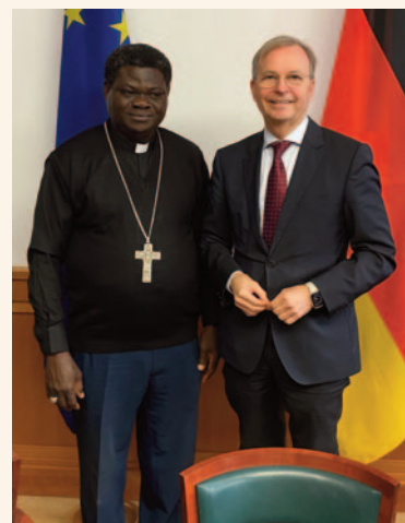
In Berlin hat Bischof Anagbe den Beauftragten der Bundesregierung für Religionsfreiheit, Thomas Rachel, getroffen.

Er kritisierte, dass Christenverfolgung oft „nur eine flüchtige Schlagzeile“ sei, und rief Politiker und Verantwortliche zum Handeln auf, um entschiedener gegen Verfolgung vorzugehen. „Lasst uns eine Kirche sein, die mahnt! Eine Kirche, die auf Christenverfolgung reagiert. Eine Kirche, die mit dem gekreuzigten Christus an den Orten der Welt steht, wo Menschen heute das Kreuz tragen“, forderte der Bischof.