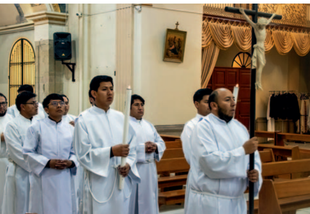
Verschiedene Persönlichkeiten, aber ein gemeinsames Ziel.

Dieses Wort Christi gilt auch für Bolivien, wo die Kirche dringend mehr Priester benötigt. Die 20 jungen Männer, die am Priesterseminar St. Josef von Cochabamba ausgebildet werden, stammen nicht nur aus verschiedenen Teilen des Landes, sondern auch aus ganz unterschiedlichen Lebenswirklichkeiten.