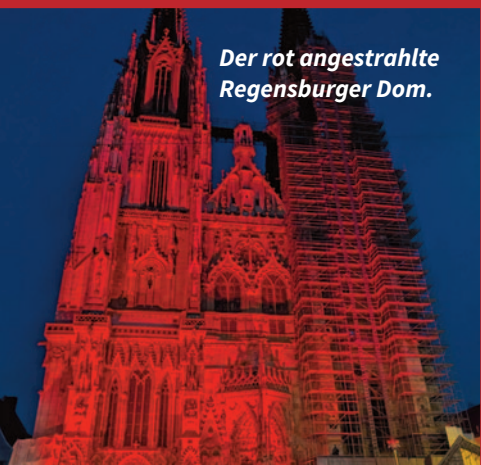
Der rot angestrahlte Regensburger Dom.