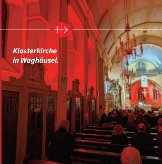
Klosterkirche in Waghäusel.

Vielen Dank an alle Gemeinden, die ein sichtbares Zeichen der Solidarität mit den verfolgten Christen gesetzt haben.