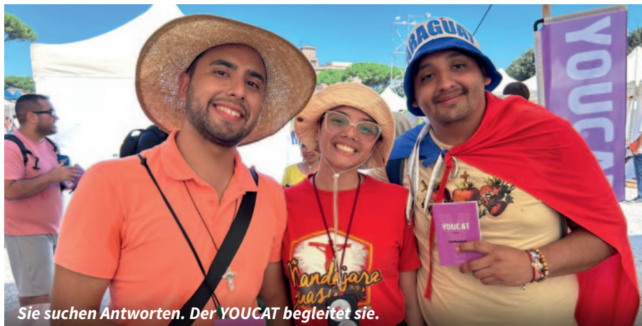
Sie suchen Antworten. Der YOUCAT begleitet sie.

„Von den Berufungen, zu denen Gott Männer und Frauen berufen hat, ist die Ehe eine der edelsten und höchsten“, schrieb Papst Leo XIV. anlässlich des 10. Jahrestages der Heiligsprechung der Eheleute Zélie und Louis Martin, der Eltern der heiligen Thérèse von Lisieux.